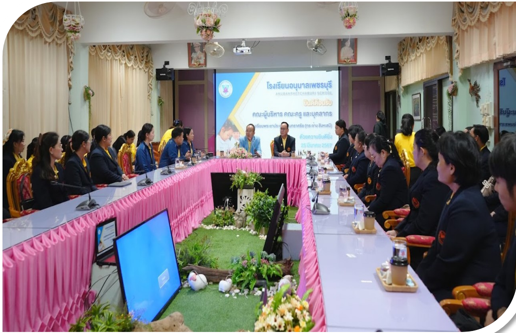
โรงเรียนพระยาประเสริฐสุนทราศรัย (กระจ่าง สิงหเสนี) ศึกษาดูงาน ณ โรงเรียนอนุบาลเพชรบุรี เกี่ยวกับการจัดการเรียนการสอน การดำเนินงานของสถานศึกษา